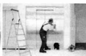
Servis 24 hodín