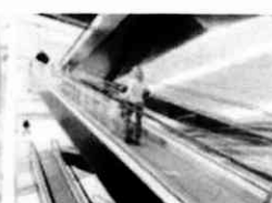
Eskalátory & pohyblivé chodníky