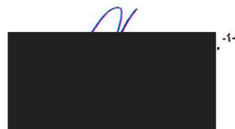
Konateľ Slovak EduTeam - SET, s. r. o.